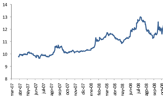
Tasa Nominal TES Julio 2020