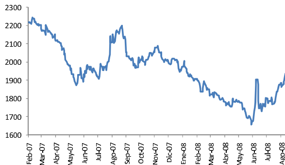
Tasa de Cambio Peso/USD

Luego del fuerte ascenso observado en la tasa de cambio, se espera que en la jornada del miércoles se presente un movimiento de corrección a la baja, dando un descanso al comportamiento devaluacionista de las últimas jornadas.